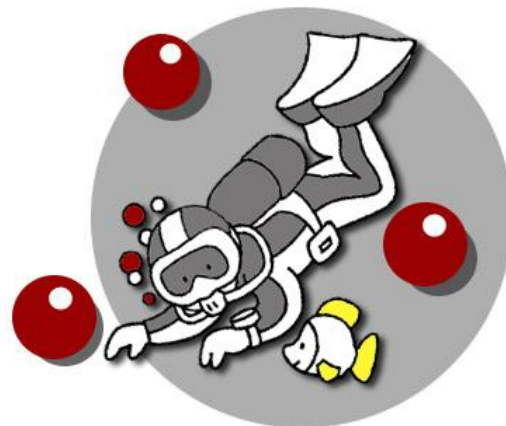
Tauchprojekt Heinrich Neumann Schule