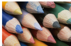
Kreativität hilft auch beim Lernen